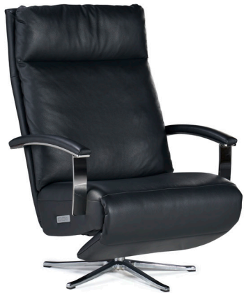
Sessel Breit 96.5, Leder / Fauteil large 96.5, cuir Armteile 90.1 chrom glanz offen / accoudoir 90.1 chrom brillant ouverte Fuss V 993 Chrom glanz / pied V 993 chrom brillant