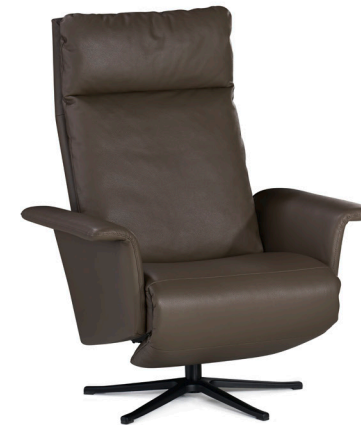
Sessel 95.5, Leder / Fauteil 95.5, cuir Armteile 90.4 bezogen schmal, geschl. / accoudoir 90.4 garni étroit, fermé Fuss standard schwarz, pulverbeschichtet / pied standard revêtu de poudre en noir