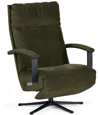
Sessel 95.0 nieder, Leder / Fauteil 95.0, cuir Armteile 90.5 schwarz, offen / accoudoir 90.5 noir, ouverte Fuss standard schwarz, pulverbeschichtet / pied standard revêtu de poudre en noir