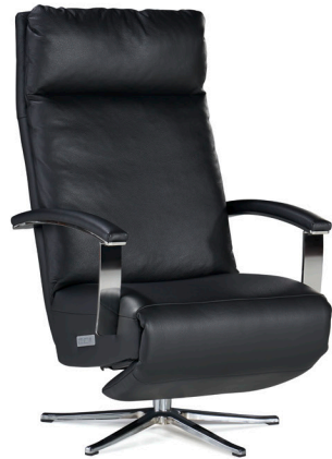
Sessel 95.5, Leder / Fauteil 95.5, cuir Armteile 90.1 chrom glanz offen / accoudoir 90.1 chrom brillant ouverte Fuss V 993 chrom glanz / pied V 993 chrom brillant