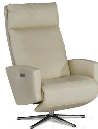
Sessel 95.5, Leder / Fauteil 95.5, cuir Armteile 90.3 bezogen breit, geschl. / accoudoir 90.3 garni large, fermé Fuss V 993 chrom glanz / pied V 993 chrom brillant