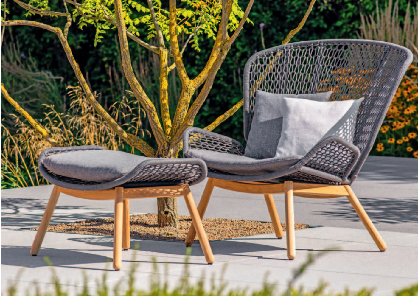
Collection Wing light