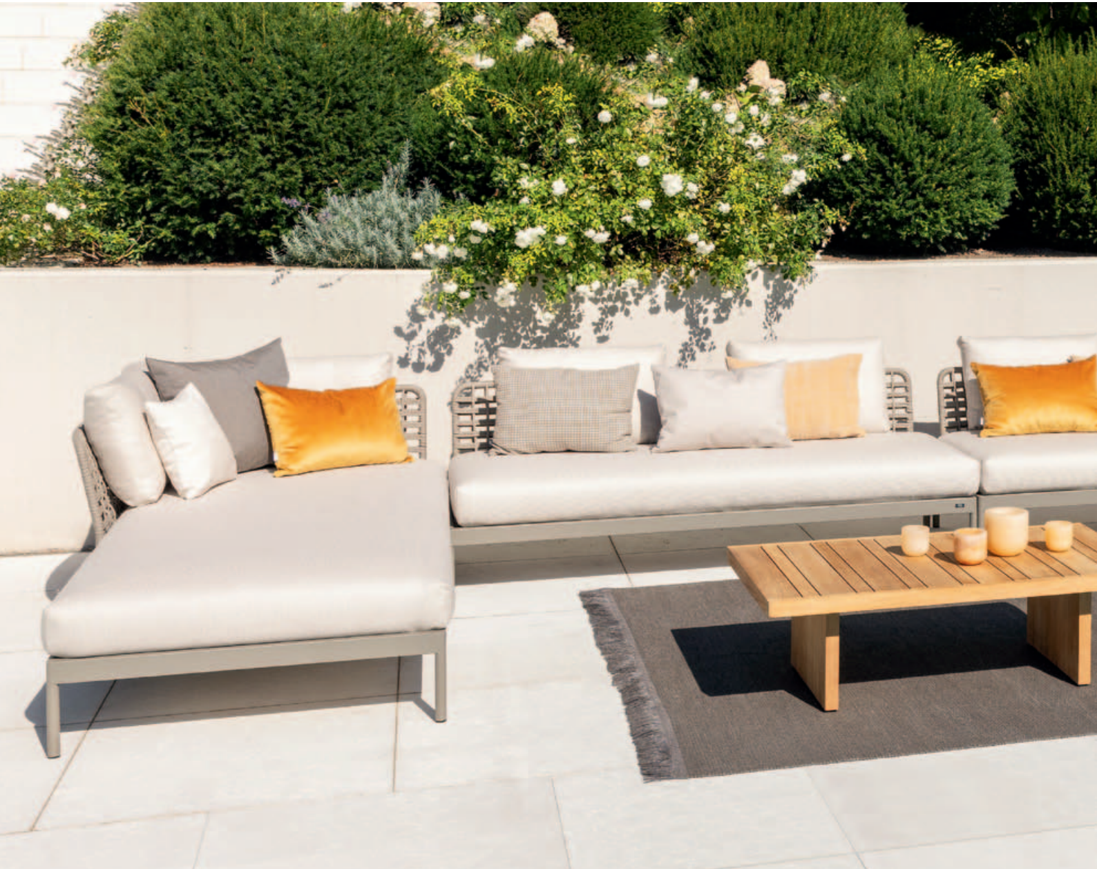
Collections Kairos, Bolero