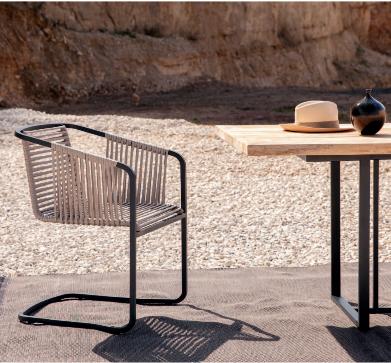
Collections Suite, Cosmo