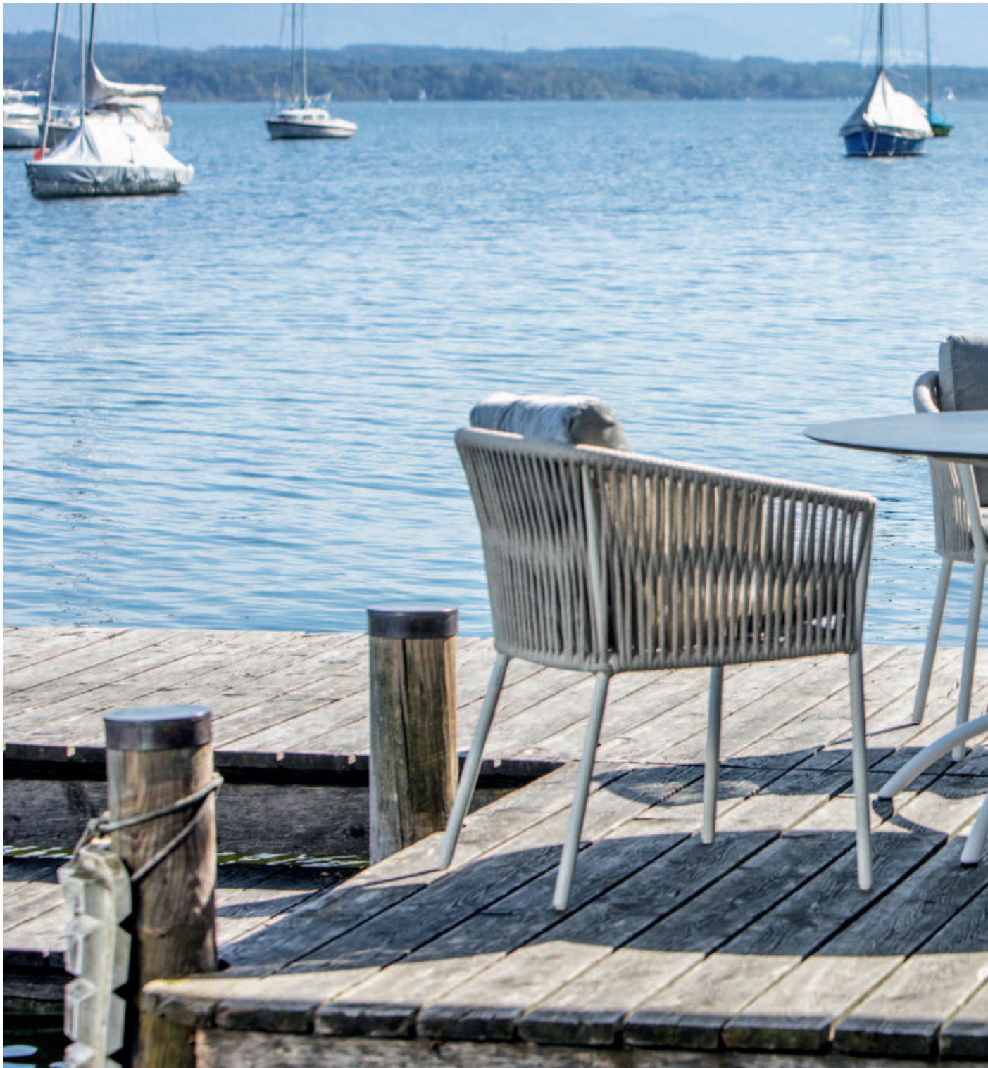
Collections Cosmo, Taku