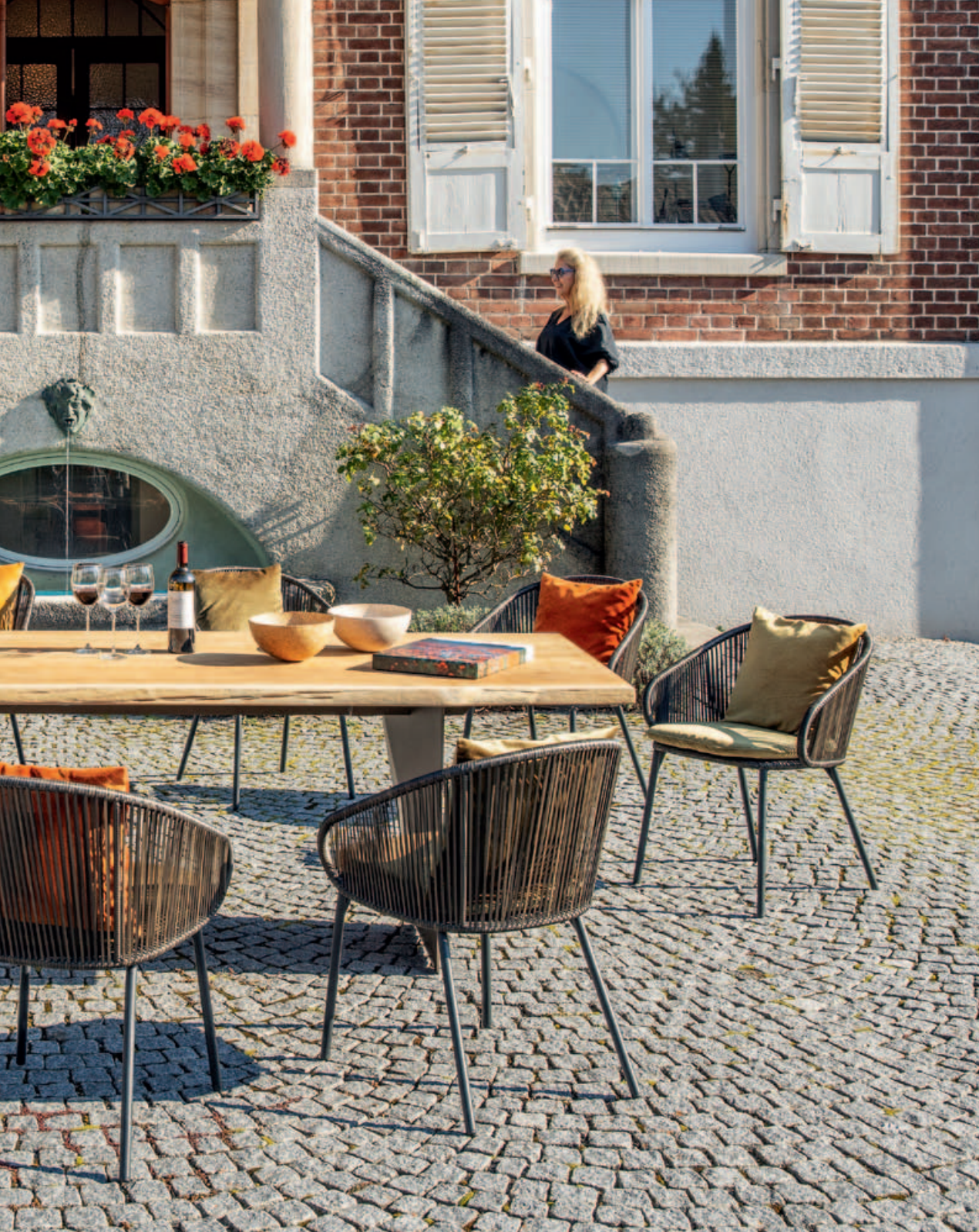
Collections Basil, Tierra