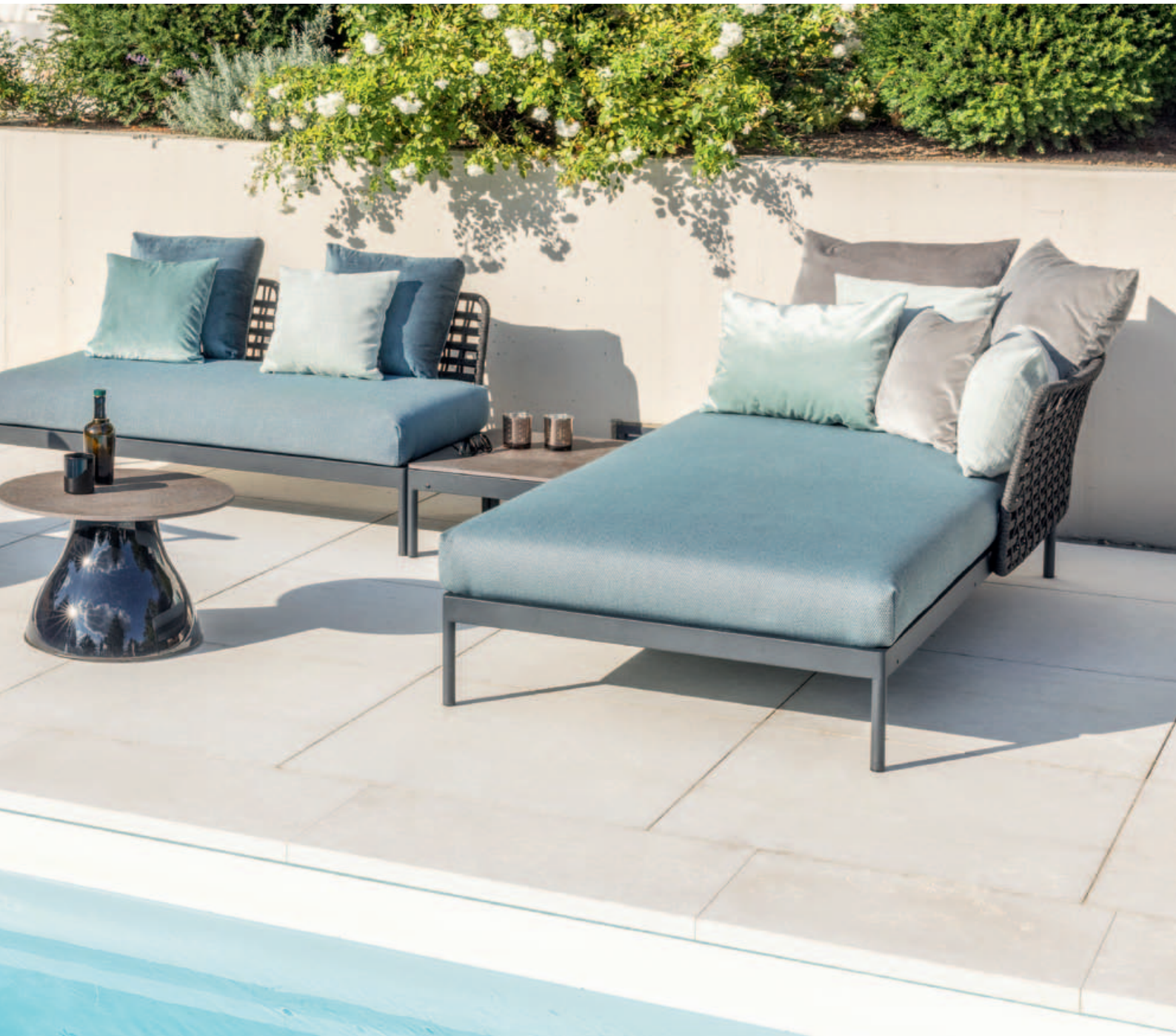
Collections Keno, Kairos, Fungo