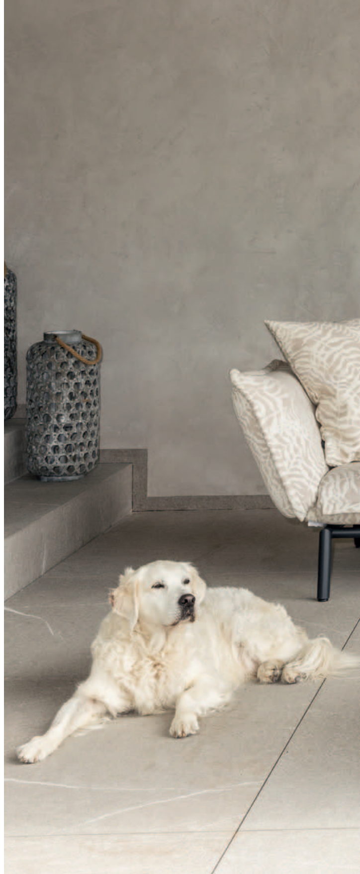
Collections Luna, Claris