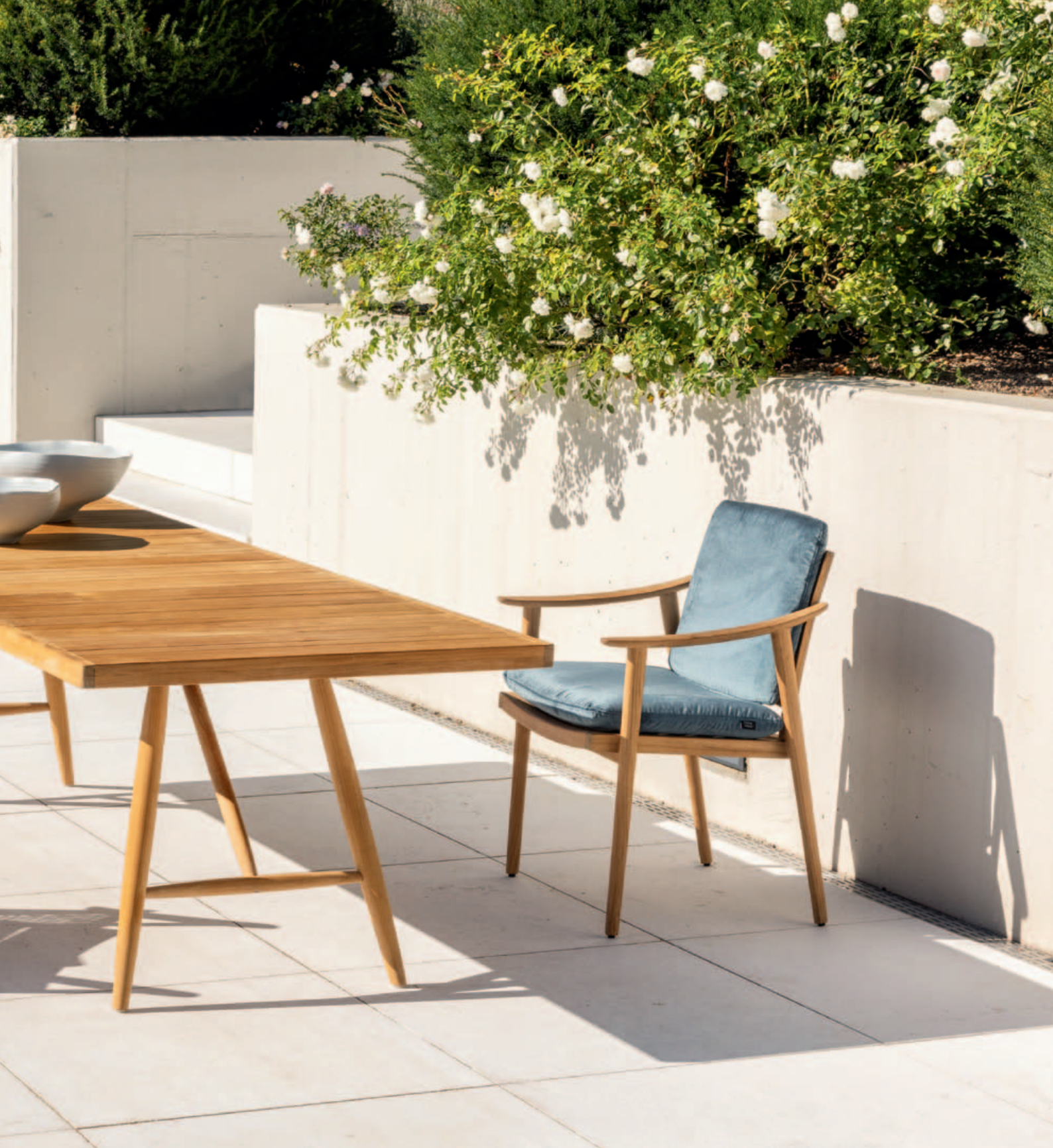
Collections Keno, Kairos, Beluga