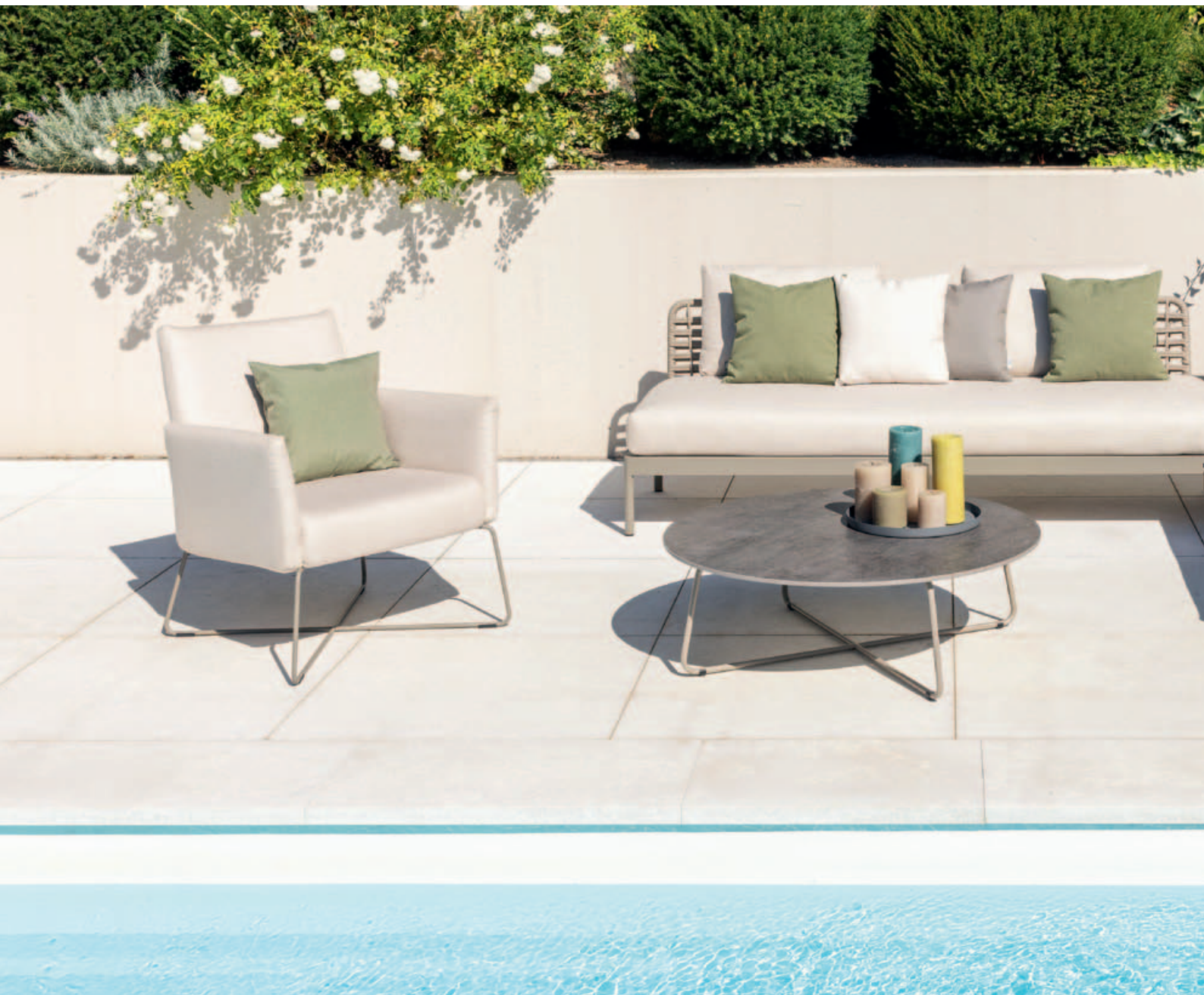
Collections Kalos, Kairos, Drop