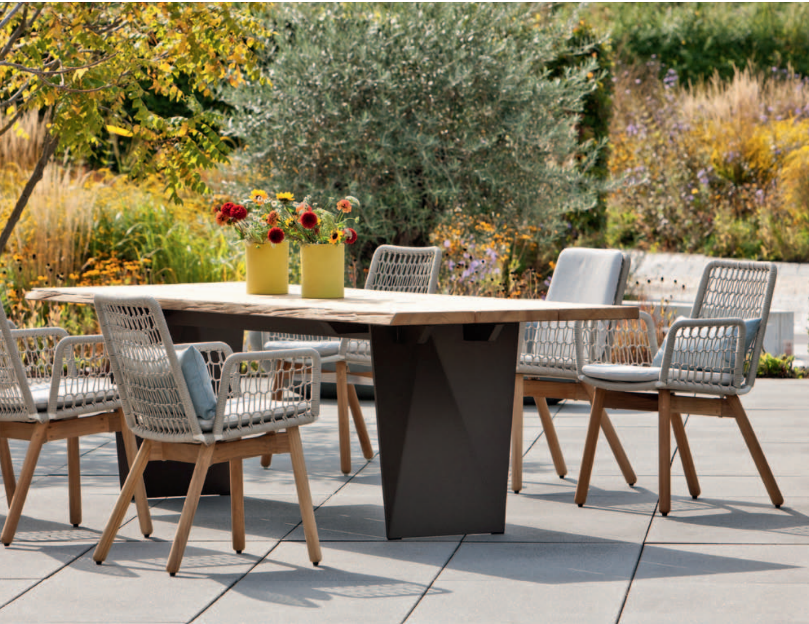
Collection Wing light, Tierra