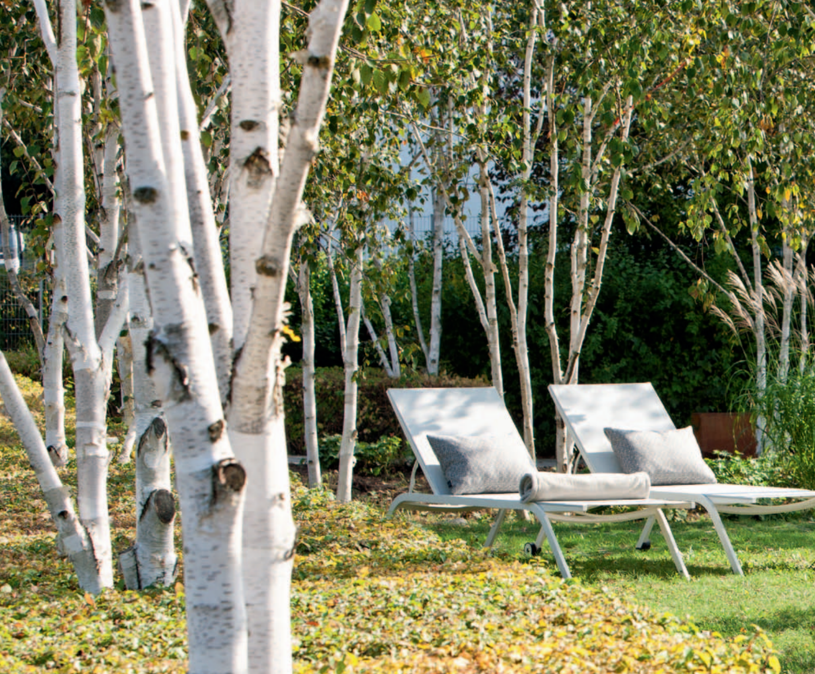
Collections Atlantic, Solo