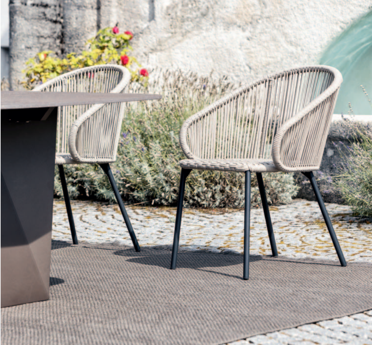
Collections Tierra, Basil