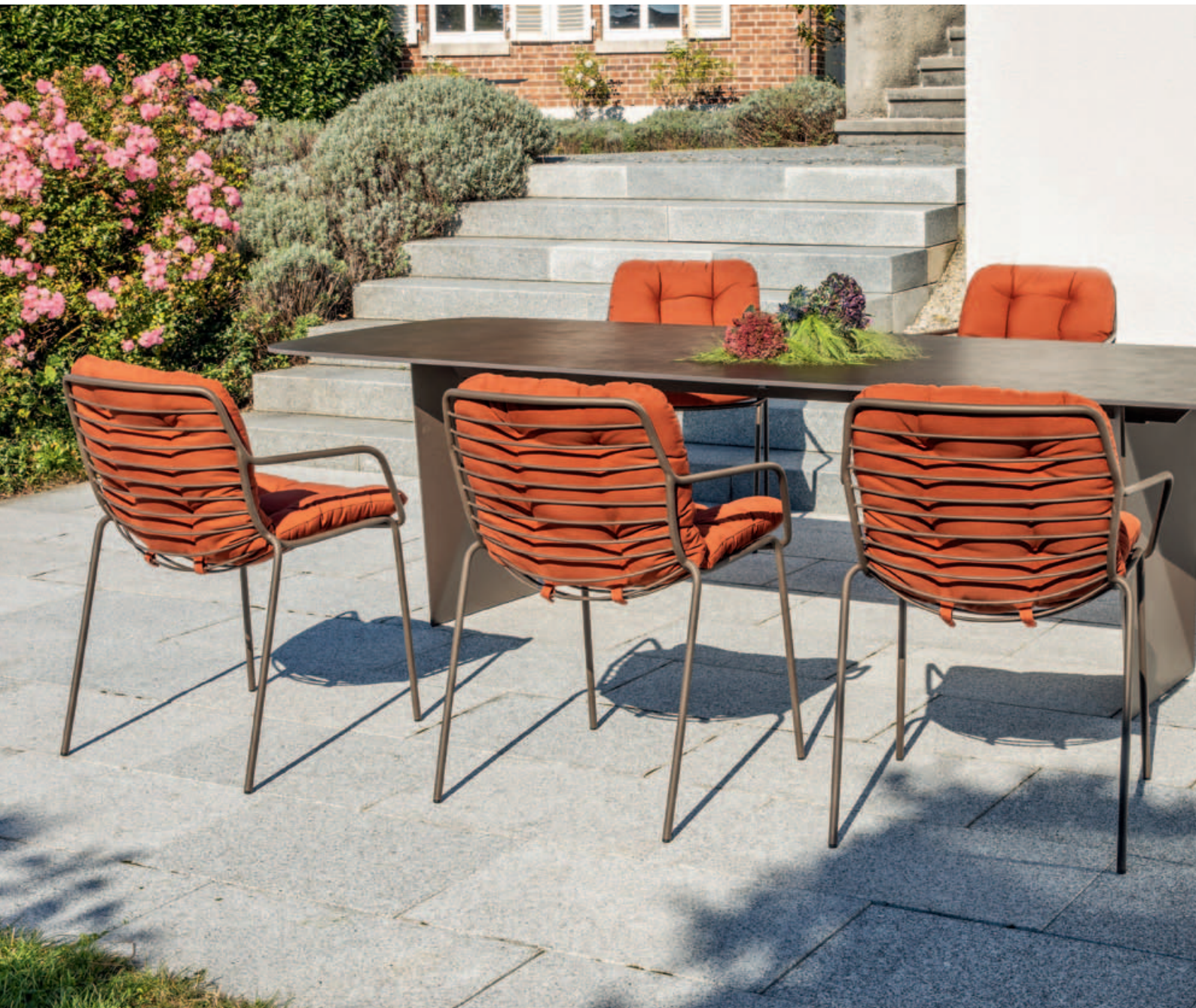
Collections Claris, Tierra