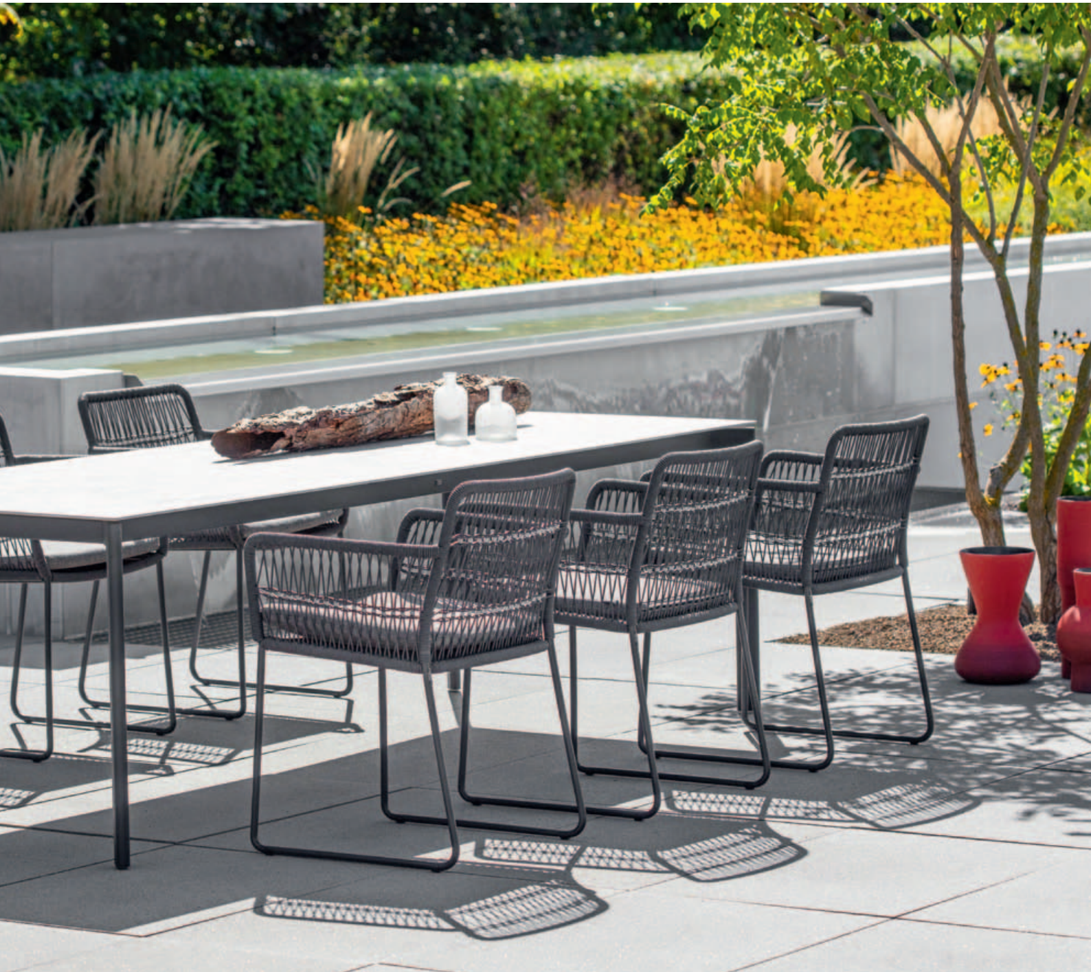
Collections Filo, Rio