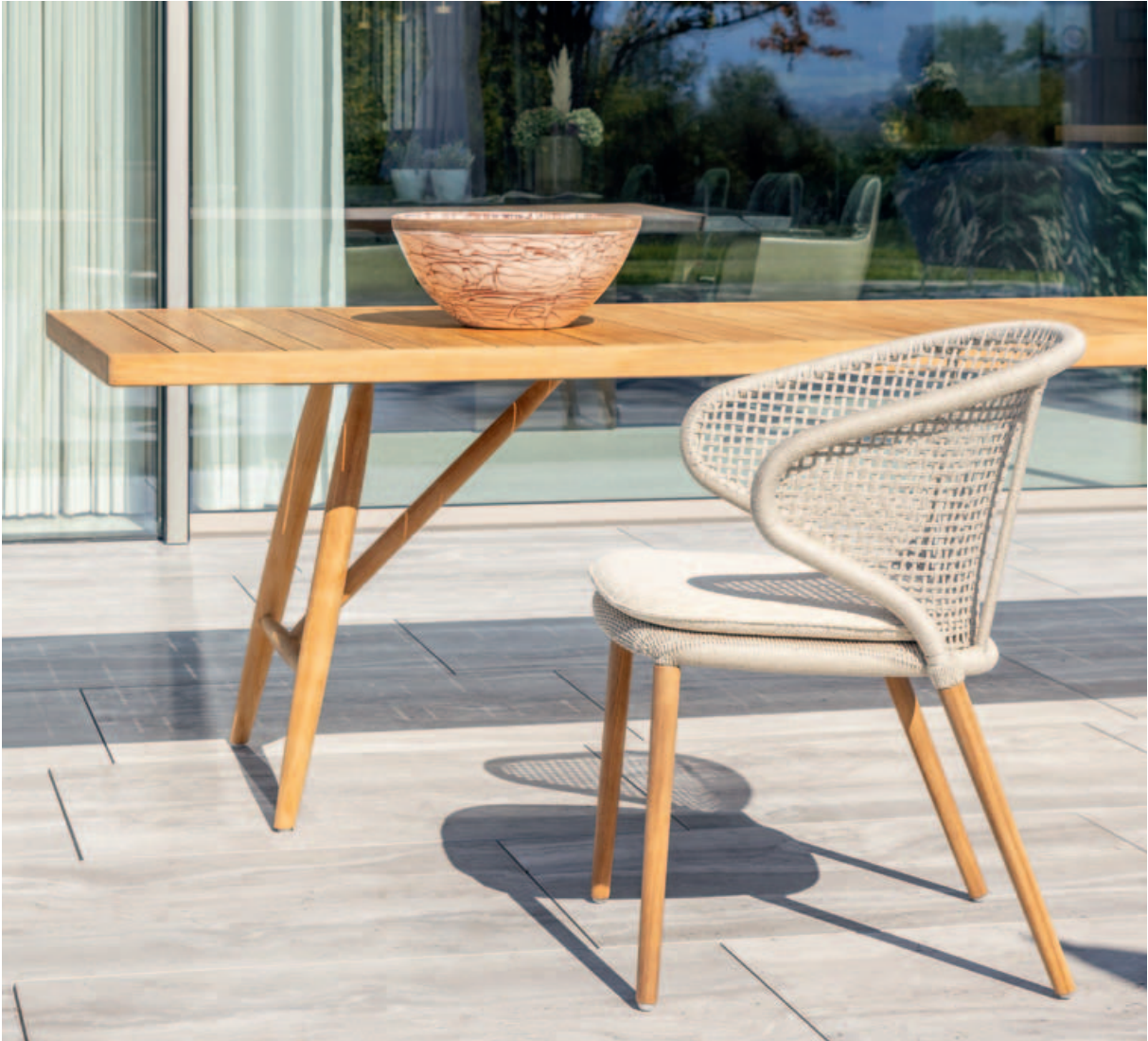
Collections Beluga, Faro