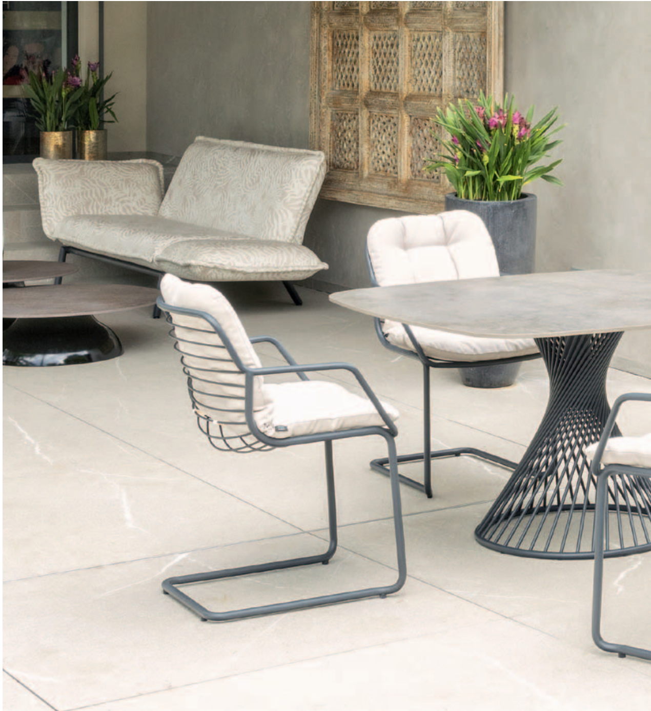
Collections Luna, Fungo, Claris, Riva