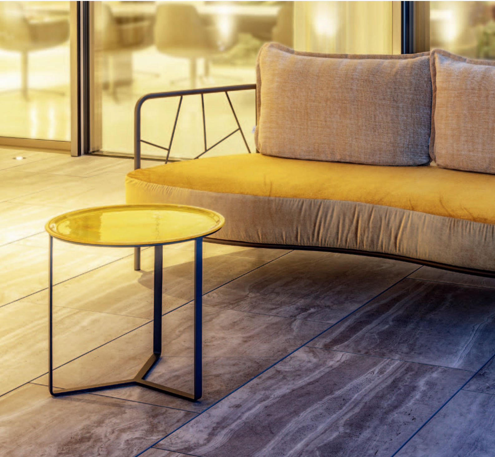
Collections Aura, Trios