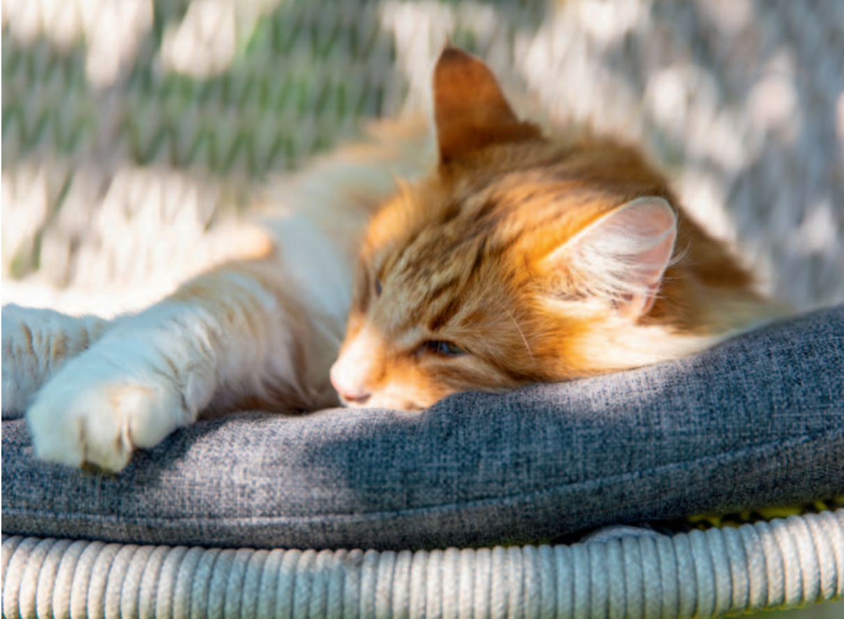
Collection Wing light