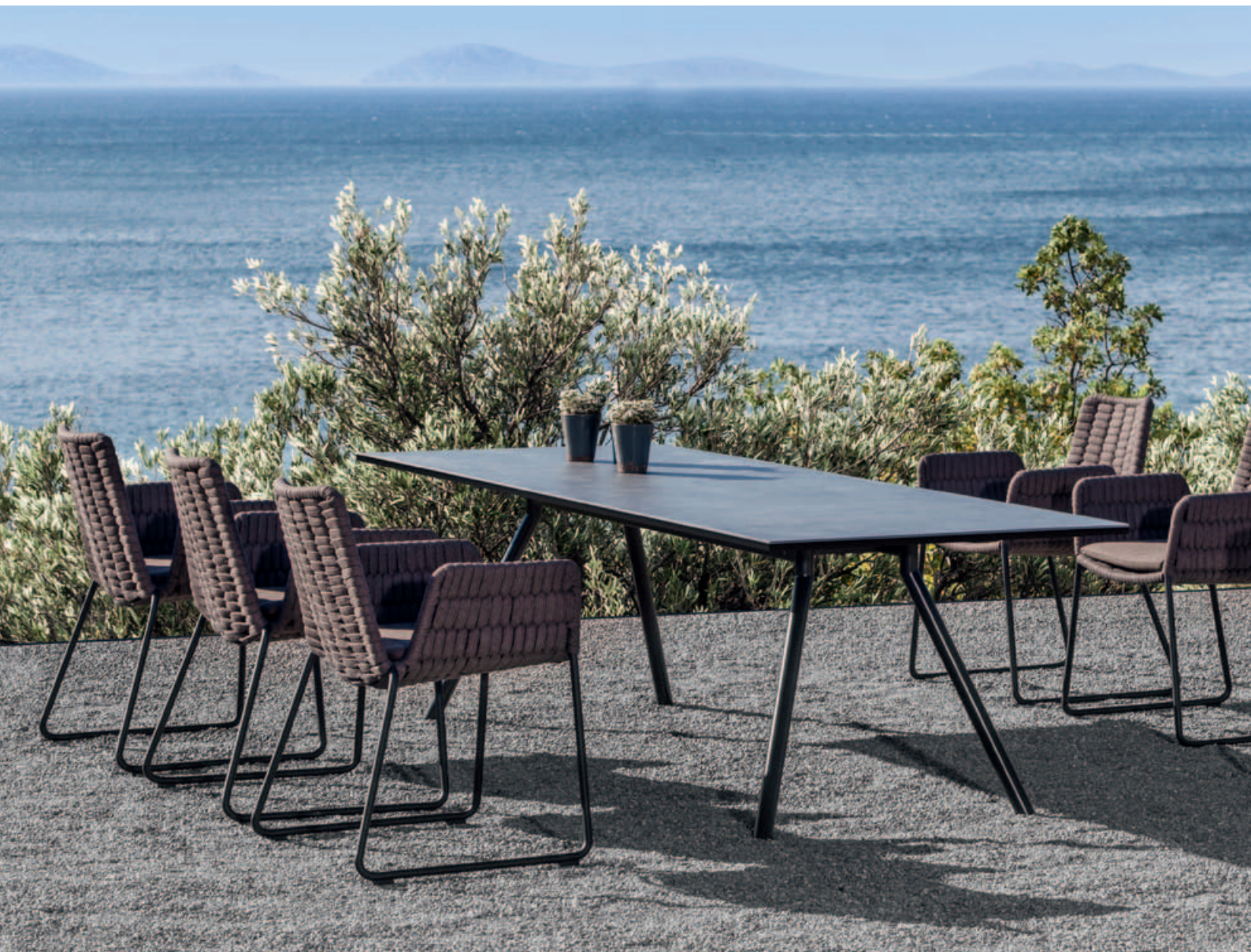
Collections Wing, Teso