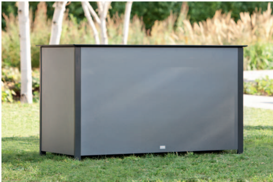
Collections Woodline, Cushion box, Aluline