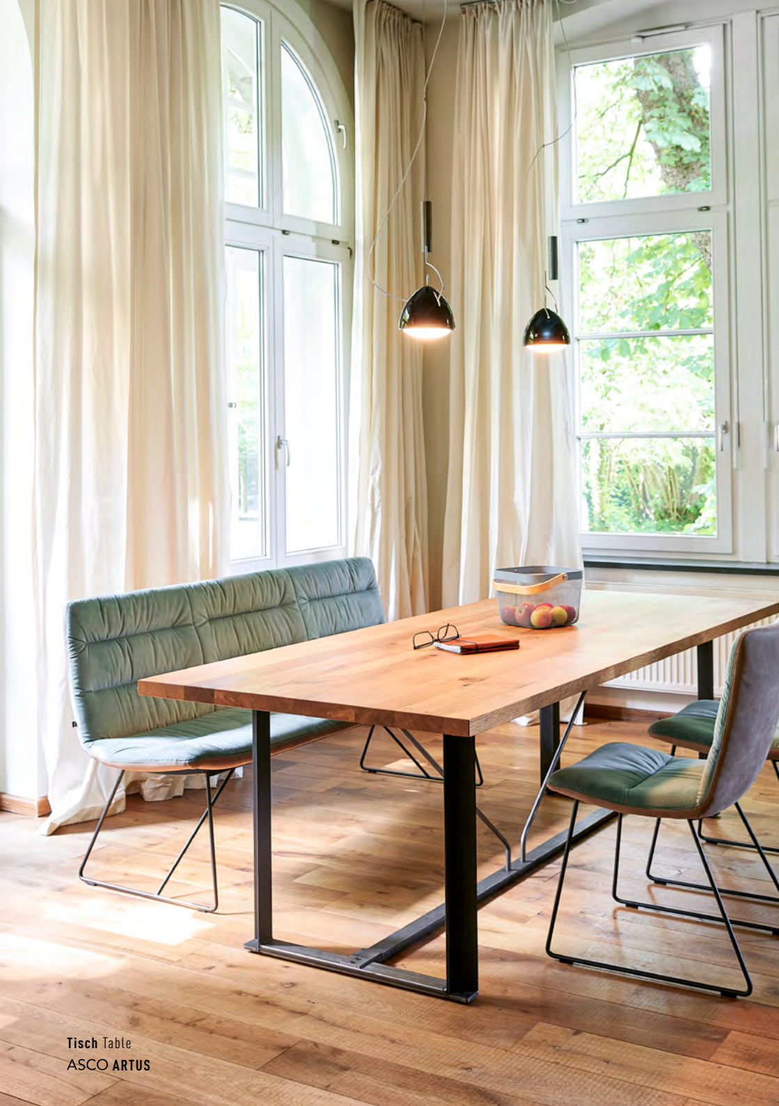
Tisch Table ASCO ARTUS