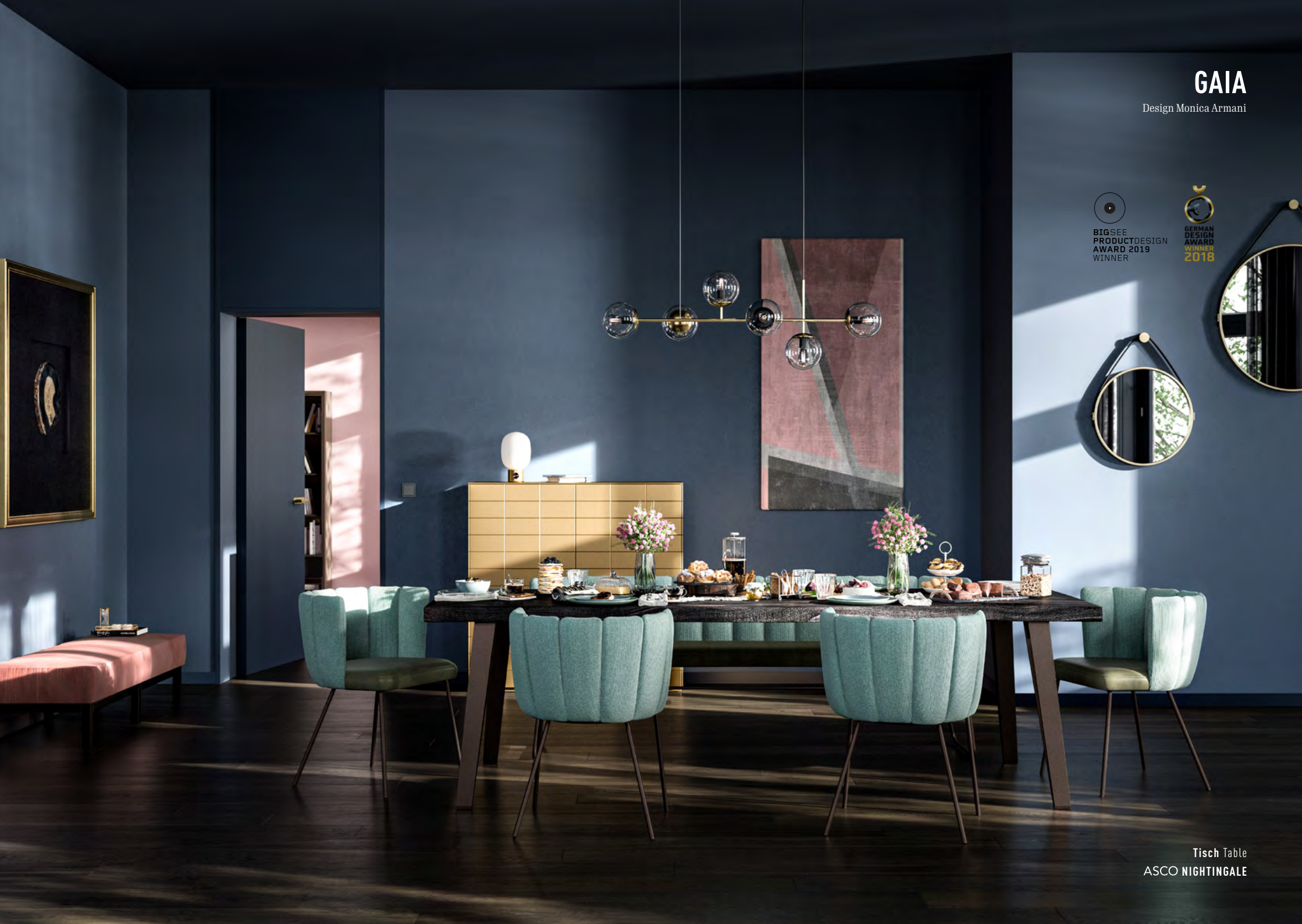
Tisch Table ASCO NIGHTINGALE