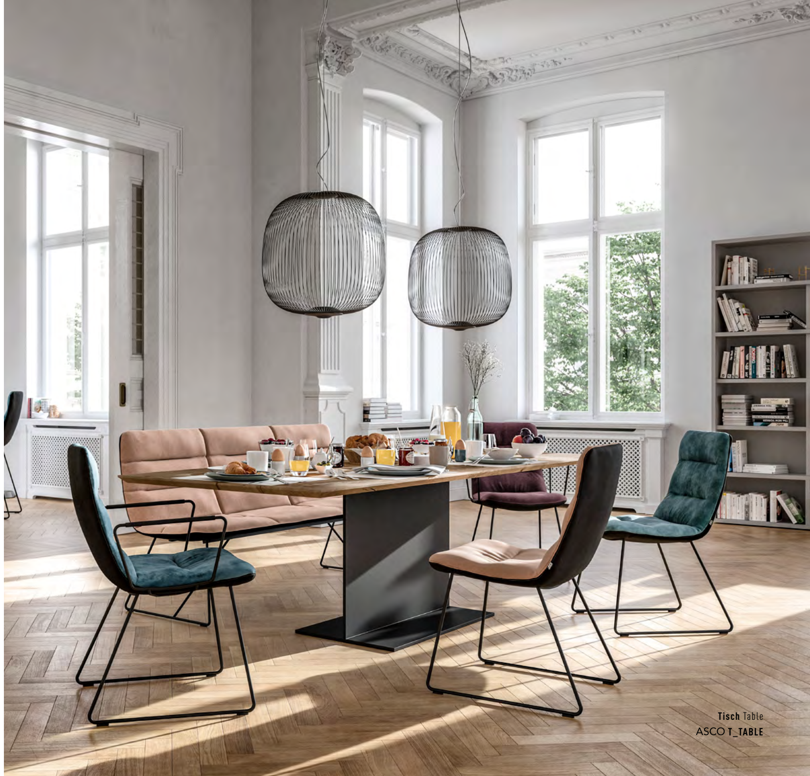
Tisch Table ASCO T_TABLE

ARVA LIGHT, figurative and young | ARVA LIGHT is the slim, directly upholstered version of the ARVA line in Mid Century design. The attractive seating furniture is ergonomically shaped, firm and upholstered to provide support in the back area. Thanks to the exceptional seating comfort and the light yet concise look, the ARVA LIGHT family is designed for innovative use. Beautifully shaped armrest and frame variations and the individual choice of coverings leave plenty of scope for personality. An appealing product family in three heights: Lounging, Dining and High Dining. Casual elegance for security and cosiness in the young private living area or in an unusual casual object.