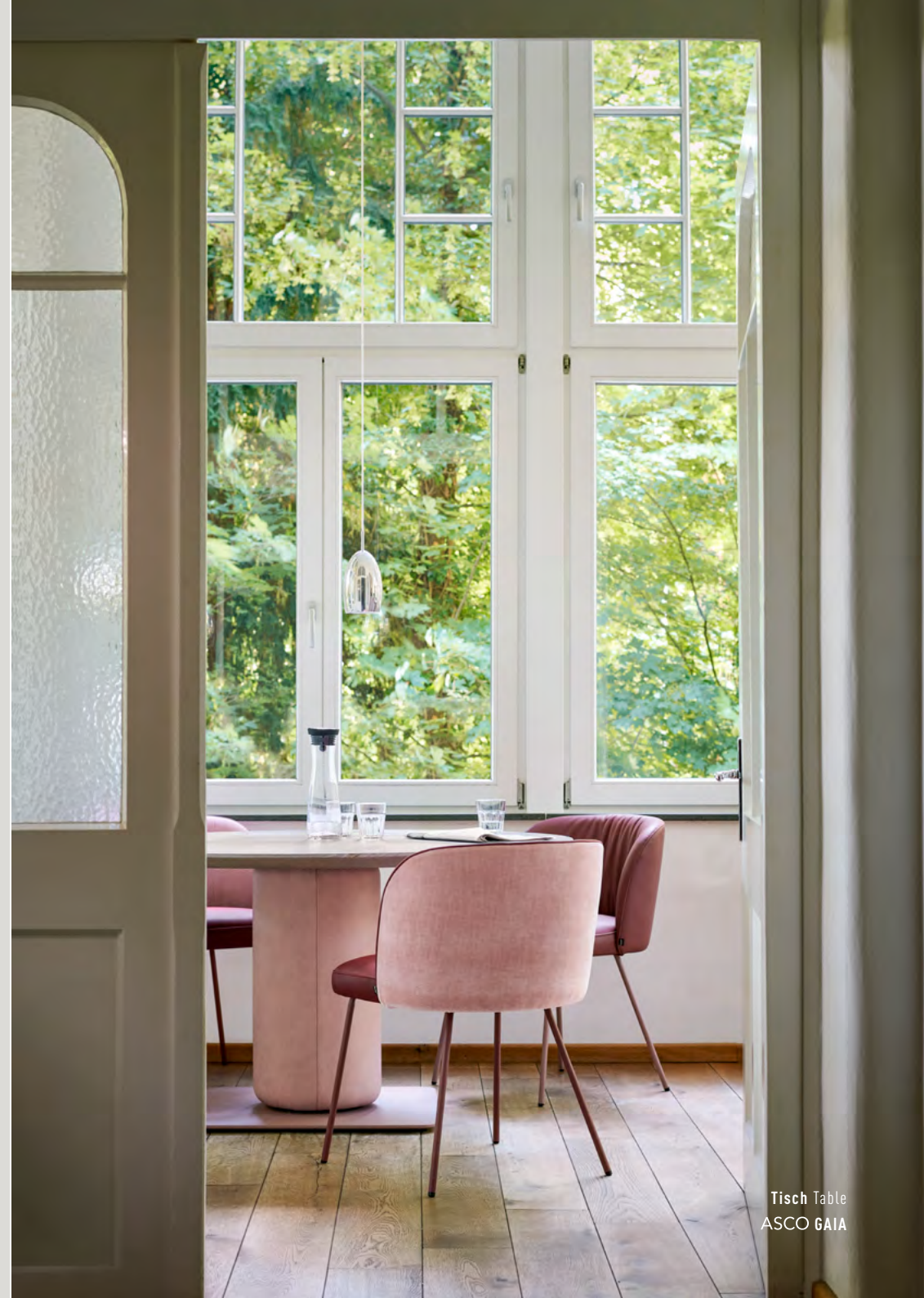
Tisch Table ASCO GAIA