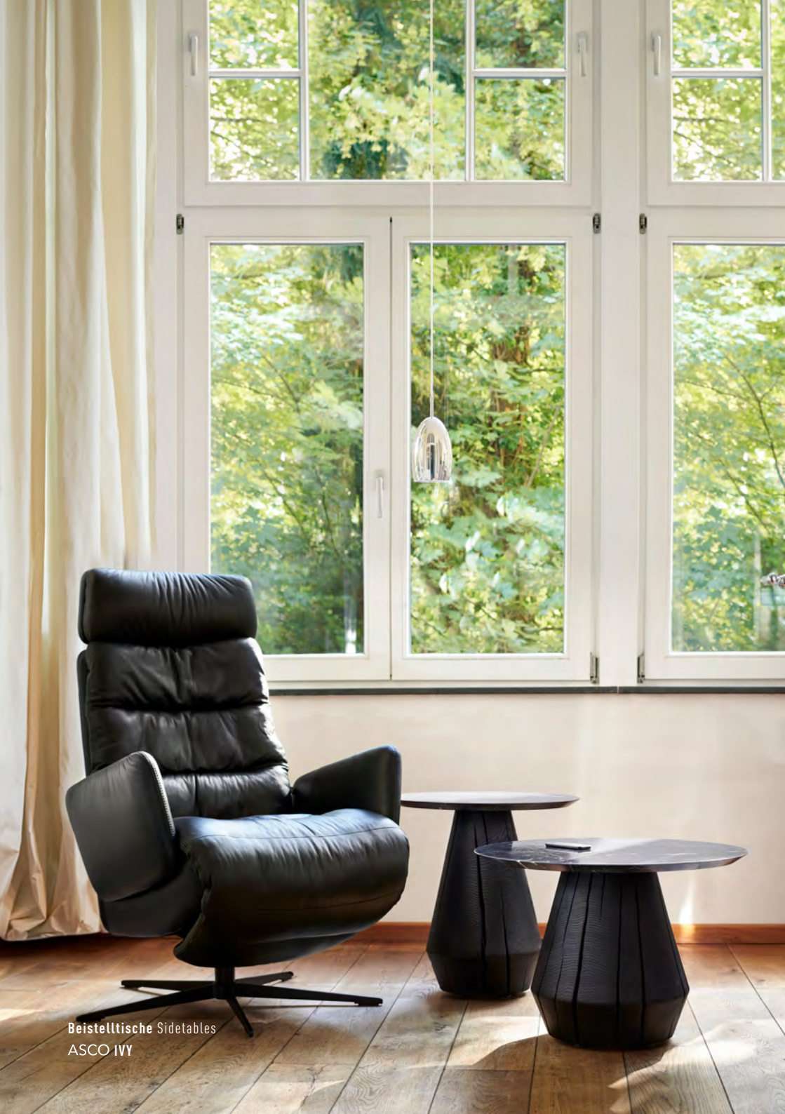
Beistelltische Sidetables ASCO IVY