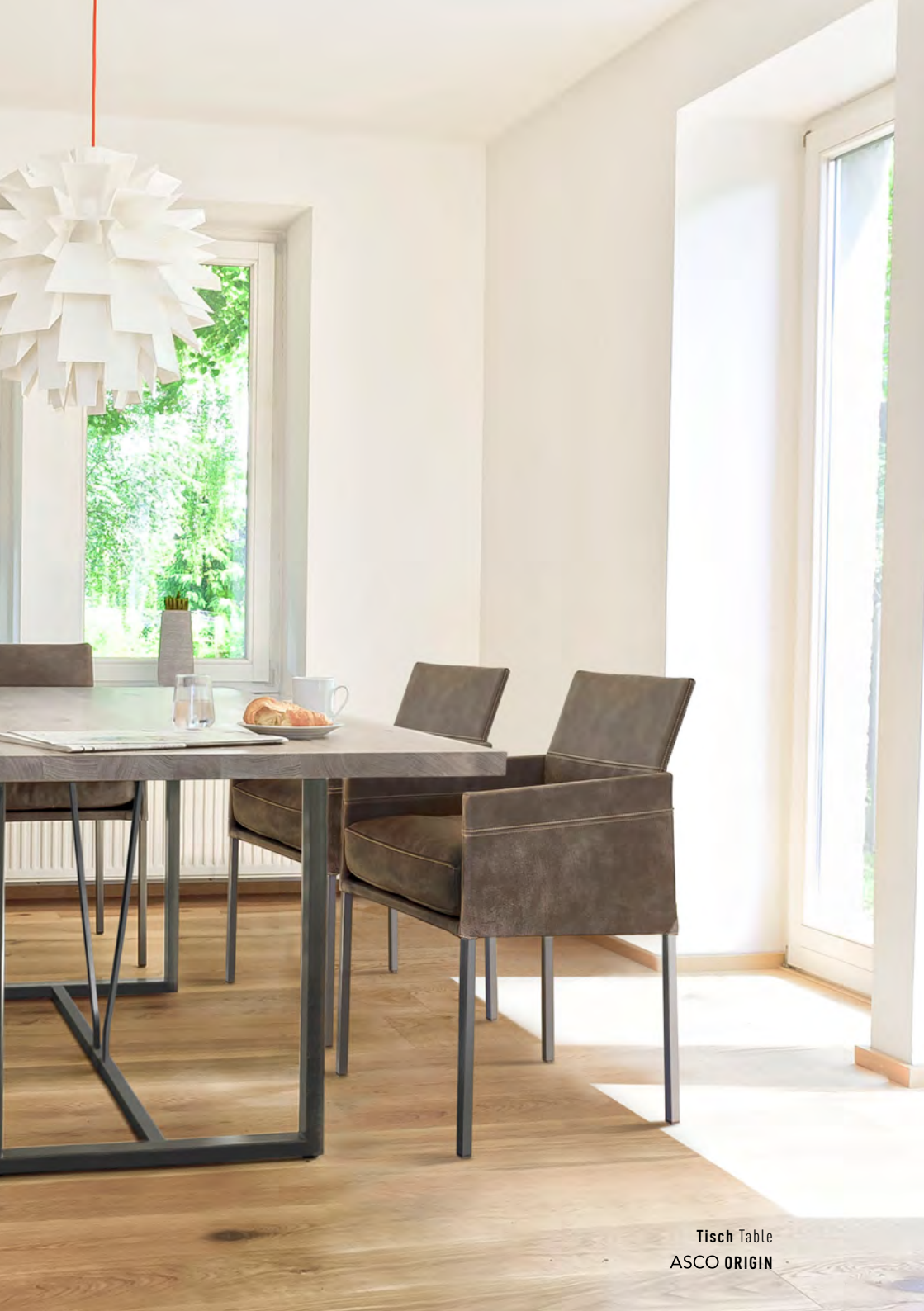
Tisch Table ASCO ORIGIN