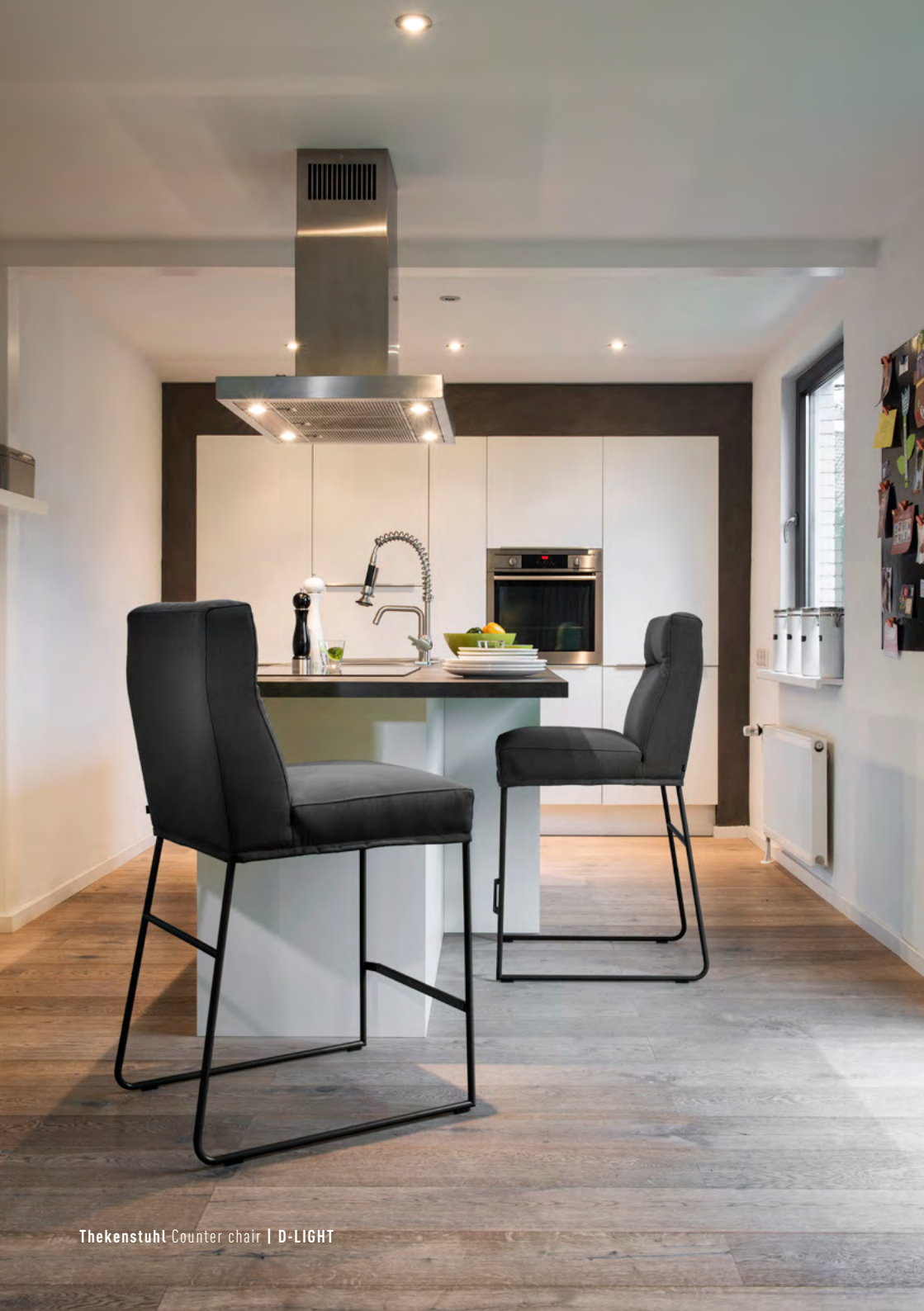
Thekenstuhl Counter chair | D-LIGHT