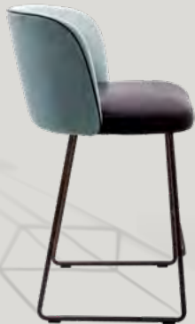
Thekenstuhl Counter chair