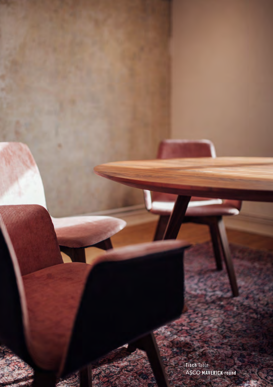
Tisch Table ASCO MAVERICK round