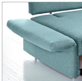
Typ 3 abklappbar