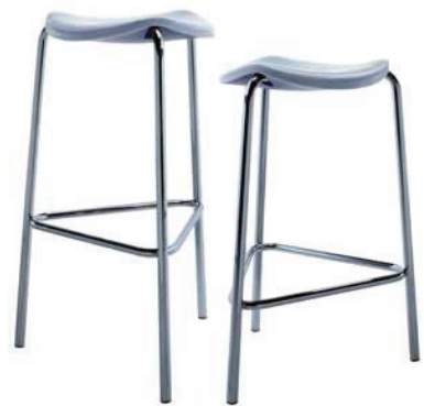
2261. WELL sgabello medio kitchen stool