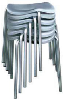
2260. WELL sgabello impilabile stackable stool

Familia de taburetes de 3 alturas, con estructura en acero cromado y asiento en polímero técnico en varios colores. El modelo básico tiene 45 cm de alto y es apilable; los modelos medio y alto, 65 y 77 cm respectivamente, están dotados de apoyapiés.