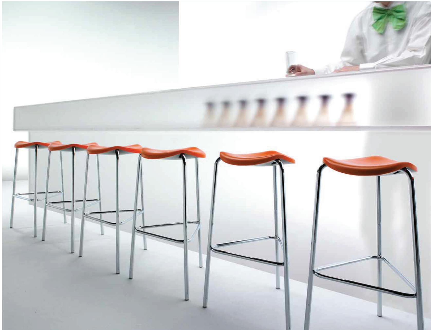
2262. WELL sgabello alto bar stool