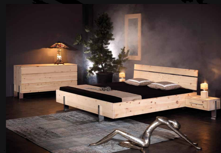
Bett Parpan • 36-5092