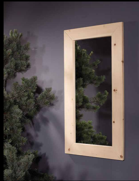
Spiegel • 12-8200