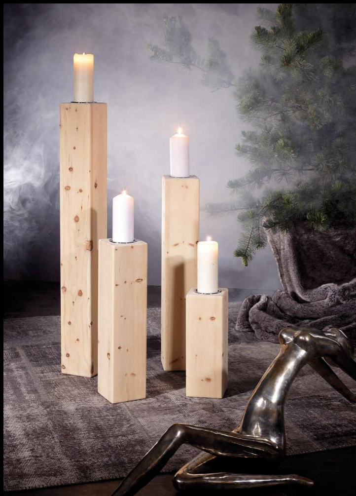
Kerzenständer • 79-14200