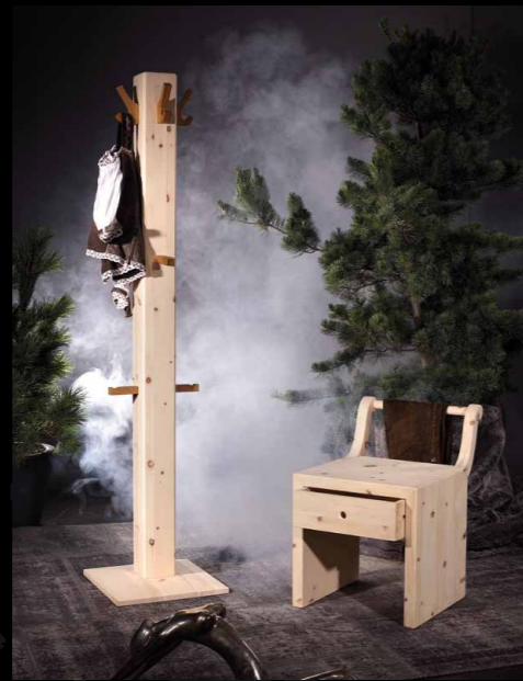
Kleiderständer / -hocker • 12-122 / 12-121