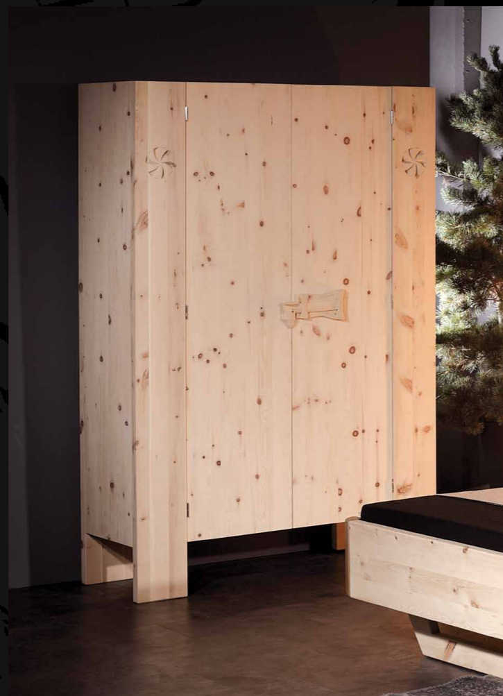
Schrank 2-türig • 22-216-45