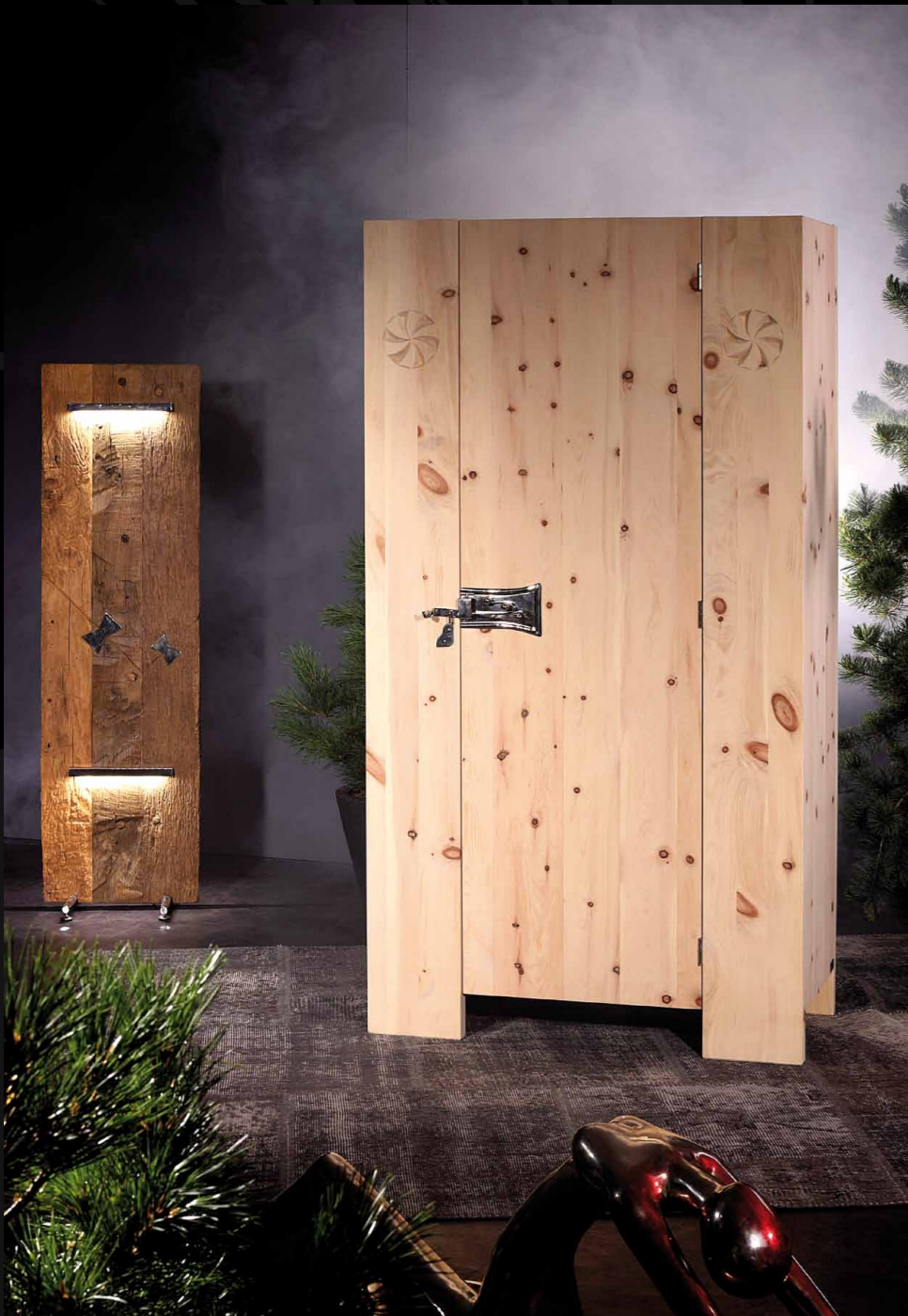
Schrank 1-türig • 22-214