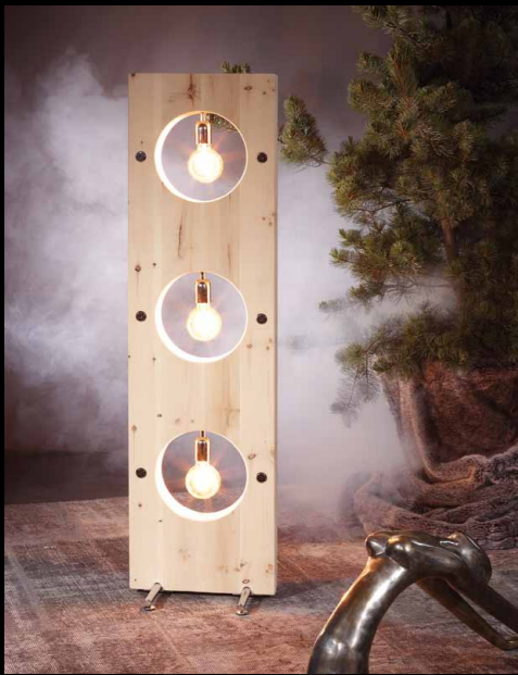
Stehlampe Montana • 12-30R