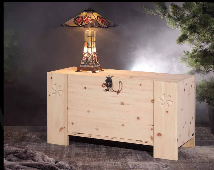
Truhe mit Klappe • 22-202