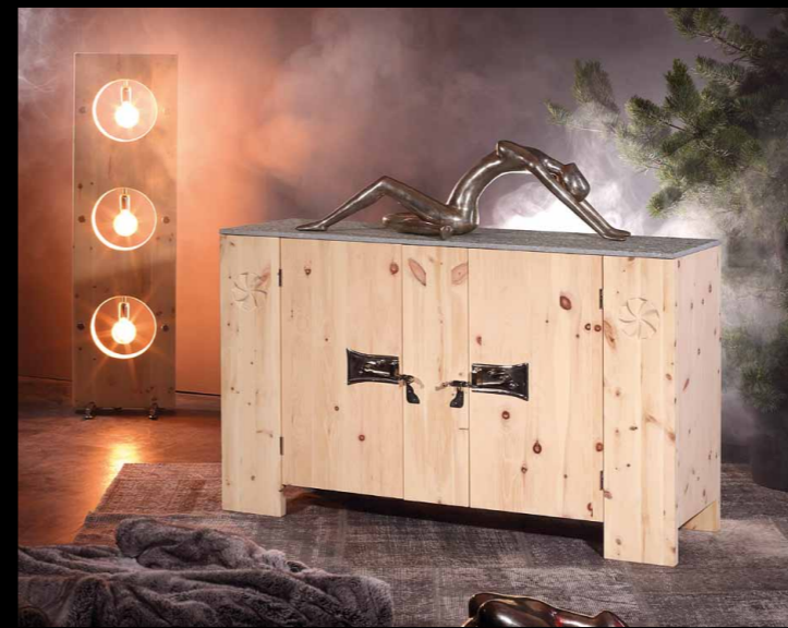
Kredenz 2-türig • 22-211