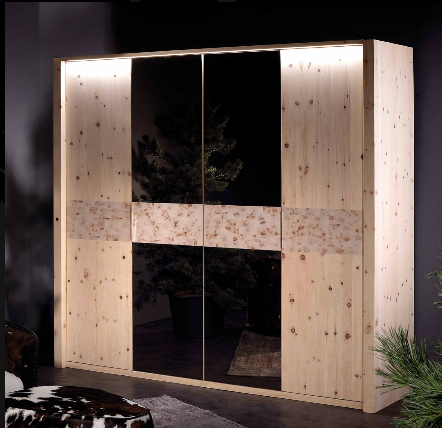
Drehtürenschrack 4-türig • 36-DRA-4