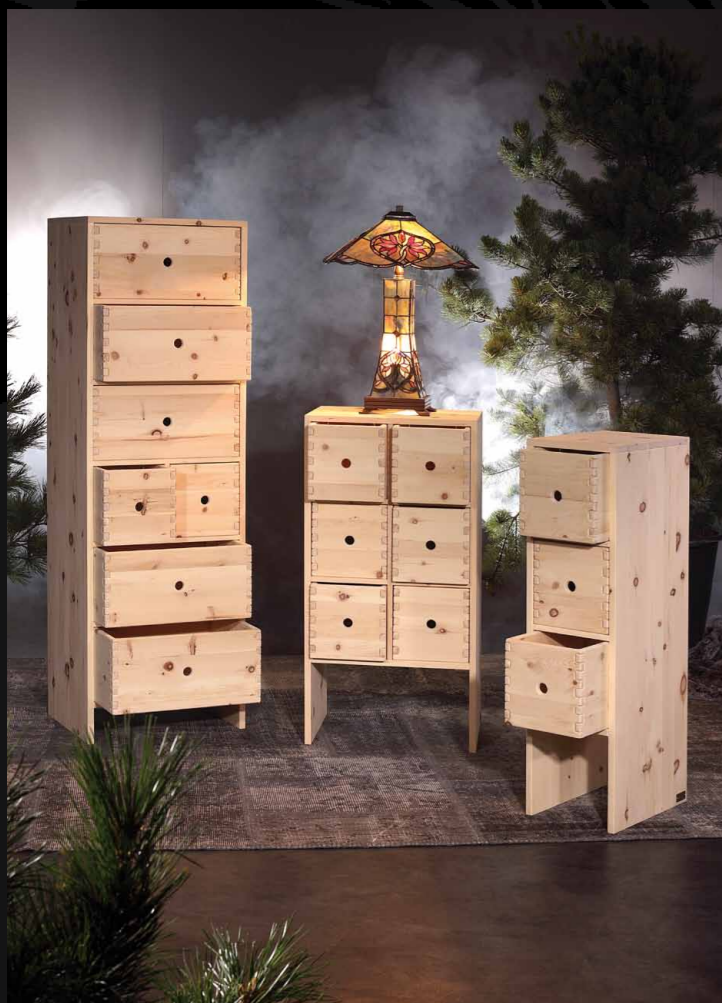
Schubladenkorpusse • 12-102, 12-101, 12-100