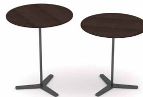
Tischplatte in Eiche EI204 Mokka, Gestell anthrazit

Mehr Inspiration zu MOX TRE EDITION WEIBELWEIBEL finden Sie hier: weibelweibel.ch Pour d'autres inspirations mettant en vedette MOX TRE EDITION WEIBELWEIBEL, visitez weibelweibel.ch For more inspiring ideas with MOX TRE EDITION WEIBELWEIBEL visit: weibelweibel.ch