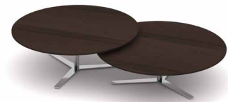
Tischplatte in Eiche EI204 Mokka, Gestell chrom glanz