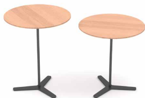
Tischplatte in Eiche EI200 Sand, Gestell anthrazit